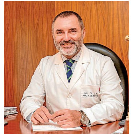
Por su consulta han pasado numerosos famosos gallegos.

Por eso le decía al principio de la entrevista, que las personas que se operan están plenamente convencidas, no lo hacen por modas. La paciente que se hace una rinoplastia, normalmente lleva años soñando con operarse, tiene un complejo, no es un capricho. Si fuese tan fácil como cambiarse de ropa, sería otro tema, pero por mucho que nos pongamos filtros en las fotos, el quirófano da respeto, y mucho.